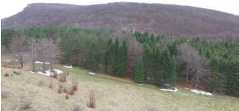
Slika: Potencijalna lokacija za skijalište “Beljanica” Žagubica

Master planom turističke destinacije “Stig - Kučajske planine-Beljanica”, koji je po nalogu Vlade Republike Srbije 2007. godine, izradio Naučno istraživački centar Ekonomskog fakulteta u Beogradu, predviđeno je da se u Opštini Žagubica realizuju dva ključna projekta I to “Izgradnja skijališta Beljanica” i “Izgradnja turističkog centra – rizort Busovata. Kao moguća investicija mogla bi biti izgradnja smeštajnih kapaciteta, kako za potrebe potencijalnog skijališta, tako i za razvoj turizma tokom čitave sezone (vazdušna banja, dečije odmaralište, studenti, biciklisti, lovci, itd...). Naravno, podrazumeva se i izgradnja svih propratnih sadržaja potrebnih za ovu delatnost, a koji mogu biti najrazličitiji, sve u zavisnosti od želje investitora.