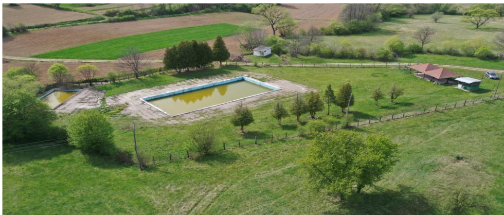
Slika: Potencijalna lokacija za banjski centar u Suvom Dolu

Vlasnički status potencijalne investicije: Republika Srbija, korisnik Opština Žagubica.