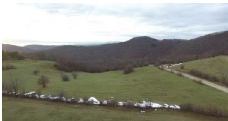
Slika: Potencijalna lokacija za vazdušnu banju u Laznici

Postoji mogućnost proširenja lokacije kupovinom dodatnog zemljišta od okolnih privatnih vlasnika.