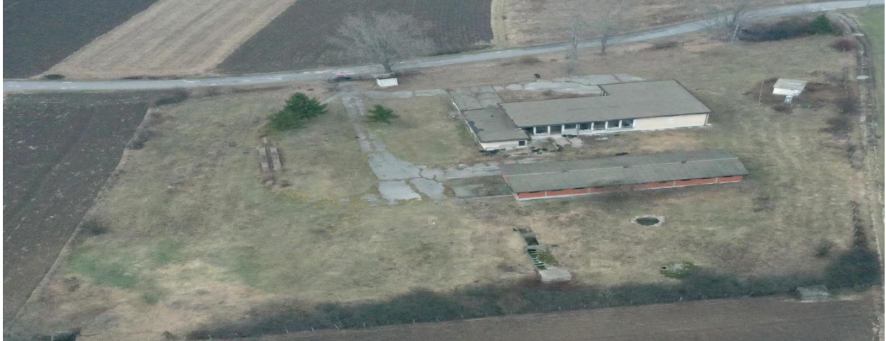
Slika: Bivša komunalna klanica u Žagubici