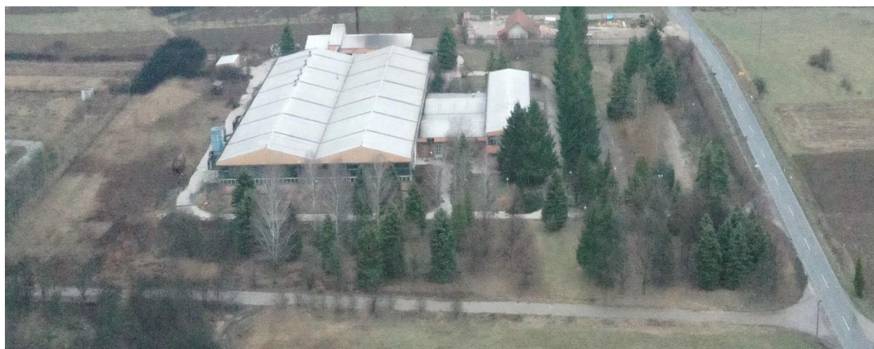
Slika: Bivša fabrika odlivaka „FOŽ“ Žagubica

Vlasnički status potencijalne investicije: Vlasništvo Opštine Žagubica.