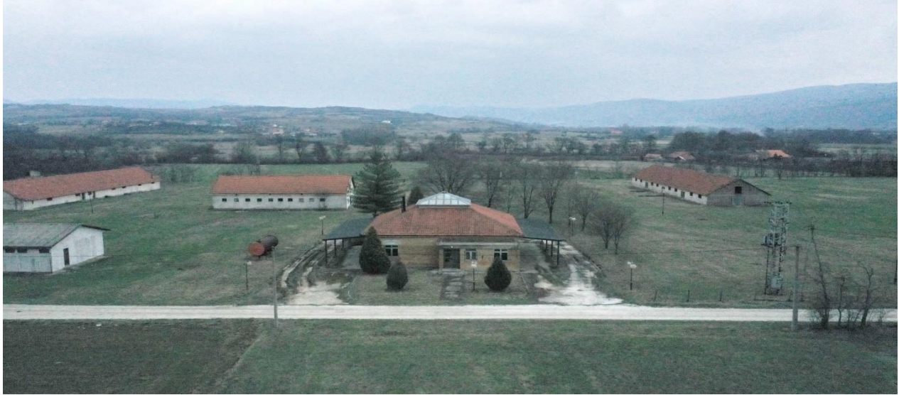
Slika: Poljoprivredni kompleks "Trška" Suvi Do

Vlasnički status potencijalne investicije: Vlasnik je Republika Srbija a korisnik Ministarstvo poljoprivrede i zaštite životne sredine.