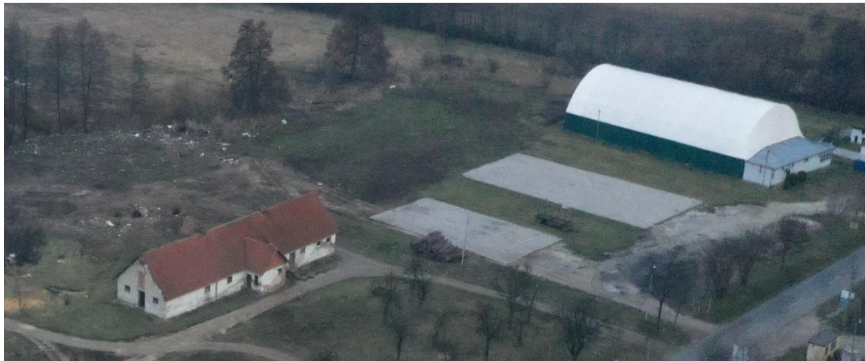
Slika: Lokacija sportsko-rekreativnog centra „Izvor“ Žagubica

objekta iznosi 1.350 m 2 . U okviru sportskog kompleksa izgrađeni su sportski teren za mali fudbal. Planira se izgradnja terena za košarku pored Balon Hale sa zajedničkim tribinama i svlačionicama, teren za odbojku, teren za odbojku na pesku, tenis i mini golf. Pored navedenog u planu je izgradnje velikog bazena i bazena za decu. Kao najveća investicija u skupu kompleksa planirana je izgradnja hotela koji bi zadovoljio sve potrebe za smeštaj gostiju. Na teritoriji opštine Žagubica postoje dobri uslovi za lovni turizam, pa bi investitorima možda bio interesantan i projekat izgradnje hotela sa dodatkom smeštajne jedinice za lovne pse. Takođe, na teritoriji opštine, postoji mapirano oko 700km biciklističkih staza, pa postoji dobra polazna tačka za razvoj ovog vida turizma.