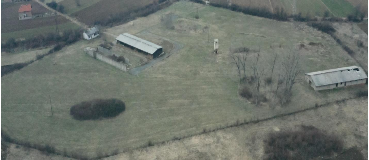
Slika: Bivša stočarska farma „Jelenac“ Žagubica

Vlasnički status potencijalne investicije: Vlasništvo opštine.